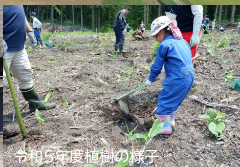
令和5年度植樹の様子